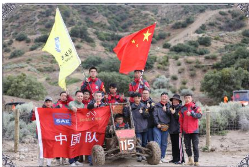
图2 学院赛车梦工厂团队

二是积极拓展学生的岗位适应能力。紧密对接产业需求设置专业，严格按国家职业资格标准确定课程内容，通过仿真实训、顶岗实践等方式将教学过程与生产过程对接，将职业资格证书与毕业证书挂钩，不断提高人才培养的针对性。在部分主干专业开展企业新型学徒制和现代学徒制试点，以赛车梦工厂项目为载体积极探索复合型高技能人才培养，切实加强学生实习和实训教学全过程管理，学生多岗位适应能力有效增强。