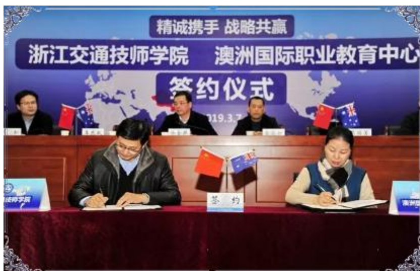
图 4 学院与 AICC 签订合作协议

五是不断深化国际合作办学。 与澳洲国际职业教育中心（AICC）合作，举办学院首个中澳合作国际班，开设汽车服务工程、会计两个专业，对接澳洲本迪戈堪培门学院、启思蒙政府理工学院、拉筹伯大学等澳洲院校，招收本科、专科两个学历层次的学生。开设中德诺浩国际班、中加班等，有 2 位中德诺浩班学生经选拔前往德国开展国际交流，享受免学费学习和免费赴德国培训。