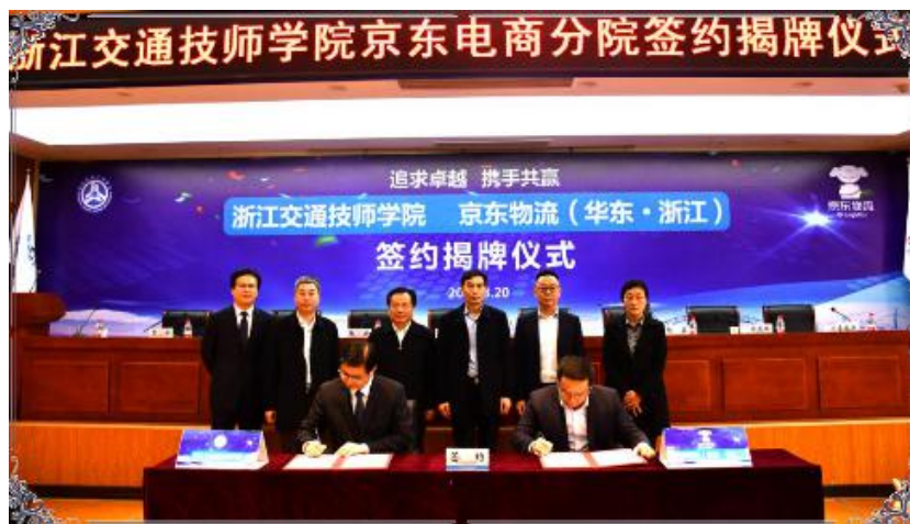
图 6 学院京东电商分院签约仪式