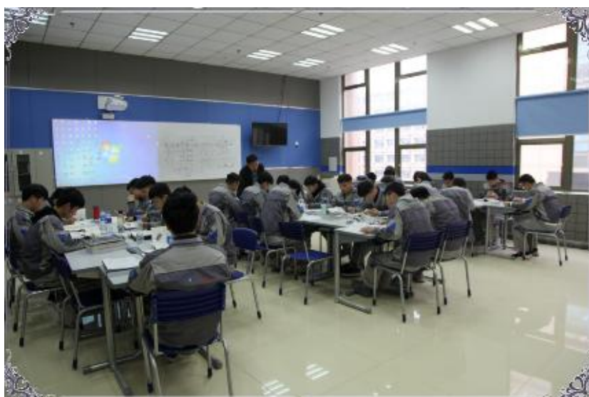
图 3 学院一体化教室场景

校内现有实训基地 8 个，实训场地面积 5.67 万平方米，与 2018 年持平；各类实训仪器设备 6900 余台套，总值 1.1 亿元，同比增长约 12%，全日制在校生生均教学仪器设备 2.06 万元。实训工位 1384 个，用人单位提供实习岗位 5500 多个，生均实训实习工位 1.29 个；校外实训基地 206 个，同比增长 5%。纸质藏书 9.77 万册，生均纸质藏书 18.3 册。