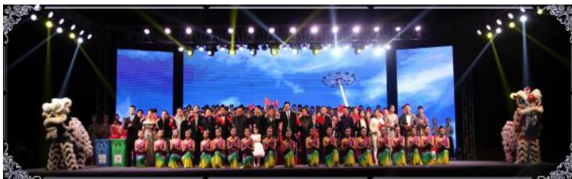
图5 庆祝新中国成立七十周年暨建校四十五周年文艺汇演

工程，通过业余党校和团校培训、专题讲座、道德讲堂等形式，开展党团知识教育，积极培育和践行社会主义核心价值观。完善校内文化氛围布置，高质量开展“同升国旗、同唱国歌”庆祝新中国成立70周年主题活动、建校45周年文艺汇演、社团文化节、校园文化艺术节、企业文化周、职教活动周、企业文化周等活动，形成“一系一品”、“一月一台戏”等师生喜闻乐见的文化品牌。积极发挥优秀传统文化对学生人文素养培育的积极作用，学院传统文化育人案例在金华市文化育人优秀案例评选中获第一名，在全省相应项目评选中获第六名。